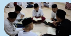
Tahsin & Tahfidh